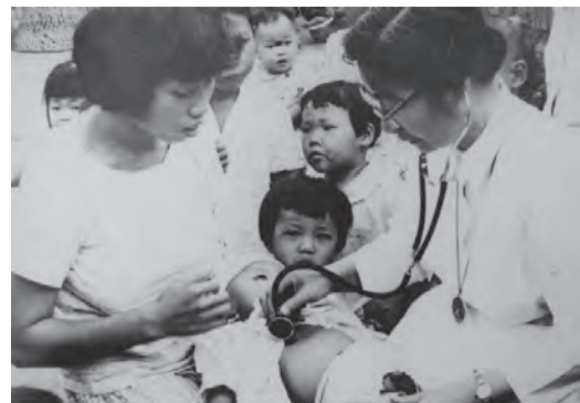
▲關懷教化服務社區，為小朋友進行體檢。