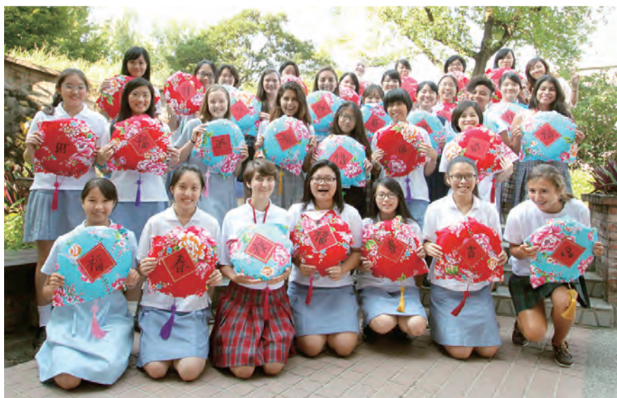
▲在聖心，學會尊重多元文化。