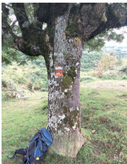
▲跟著指引，回憶著過去的聖依納爵。

聖依納爵在歸依後直至生命的終點都以「朝聖者」自居，以此來表達他對追求天主旨意的熱情；從西班牙依納爵朝聖之路回到日常生活，11名港澳台青年願意繼續走「朝聖之路」，每天藉著上主的力量和對祂的信賴前行。