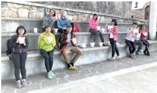
▲徒步完後的用餐總是美味