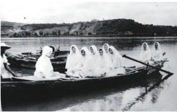
▲修女們渡船到竹圍或市區辦事和購物