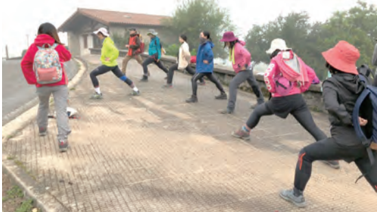
▲每天出發前，全體先來個暖身！