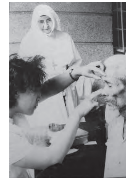
▲關懷教化服務社區，為長者體檢。