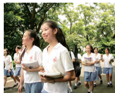
▲在聖心，學會欣賞享受大自然。