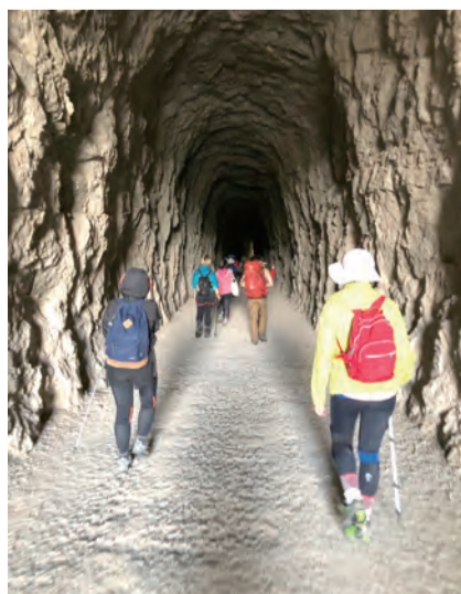
▲經過縱谷，感受希望就在隧道的那端。