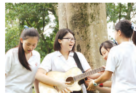
▲在聖心，學會自愛與發展自我。

無法外出工作，於是利用裁縫技巧在家製作產品，更加強化了 Story Wear永續經營品牌精神的生命力。