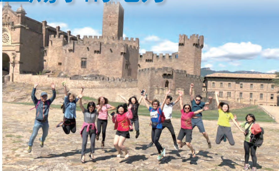
▲徒步終點站——薩威城堡，但人生旅程的朝聖仍持續進行。

從羅耀拉出發，到達曼雷薩，這640公里路程是聖依納爵的悔改歸依之路，即今之「依納爵朝聖之路」。2015年，教宗方濟各透過宗座聖赦法院的兩道法令，向參加「依納