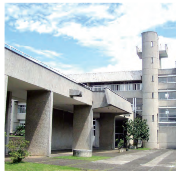
▲世界知名建築師設計的船屋建築