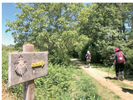
▲一步一腳印天主與我同在

走在朝聖路上，歐洲人開車很是禮讓行人，只要你走在斑馬路上，車輛一定停下來，讓行人優先，也不會隨便按喇叭，這與台灣相較之下，令我頗為感慨，感謝天主，完成了這艱難的朝聖之路，周遭朋友及姊妹們都驚訝，覺得我這樣的體能都能去，那麼，他們也能喔！是的，只要有堅定的信心，萬全的準備，天主自會「恩寵上加恩寵」的賜予我們靈性成長、力量倍增的朝聖之旅。