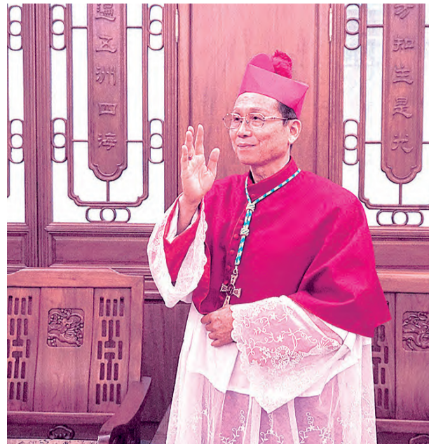
▲鍾安住總主教在接受媒體採訪後，給予期勉和降福。