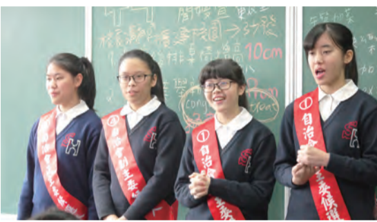
▲在聖心，鍛鍊領導力。