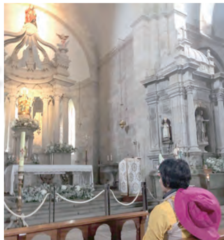
◀聖雅格大教堂廣場 ▲在教堂內祈禱

開走頭兩天覺得辛苦，腳底疼痛發紅，晚上洗澡後，開始腳按摩，推止痛凝膠、貼布、吃止痛藥、好讓腳的疼痛改善，抑制發炎，讓明天起床可以繼續走，一天一天腳好像慢慢適應了，但是遇到斜坡、上坡完又下坡，那天走的萬分辛苦，因為下坡路段，我膝蓋的骨刺非常疼痛，想快也快不了，有時還倒著走，讓膝蓋不要承載重量使不適增加，登山拐杖的黑色橡膠頭都被磨穿了，只聽到走在柏油路上時，叩、叩、叩；左右、左右，單調的聲音，有時前後都沒有人，烈日當頭，拐杖單調的噪音干擾我心禱玫瑰經，雙手撐著拐杖走路，又要施力前後擺動，無法再拿玫瑰念珠在手裡，一串一串的心裡覆誦，若打斷，就從頭來過，心裡想著為什麼意向獻上玫瑰串經，當然為自己更是不可少，我需要聖母為我轉求朝聖之路的恩寵，讓我一步一腳印，跟著黃箭頭、貝殼標示石碑，有時候覺得拐杖單調的聲音，也是另類的陪伴者，路途中看到教堂則進去