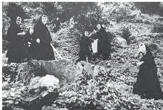
▲筆路藍縷辛勤耕耘愛的園地