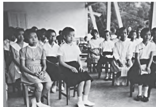
▲第一屆學生在簡易的小白屋上課