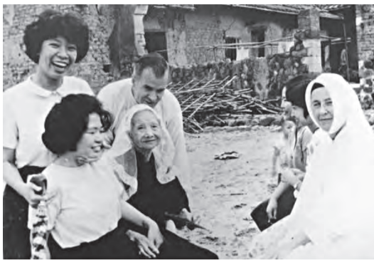
▲為社區90歲老太太付洗