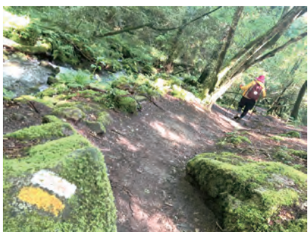
▲葡萄牙之路靈性之路段