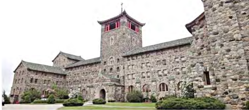
▲天主教瑪利諾修會位於紐約州的總會建築。