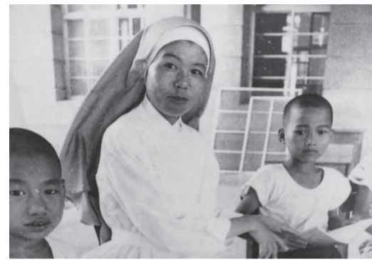
▲修女為社區小朋友講道理