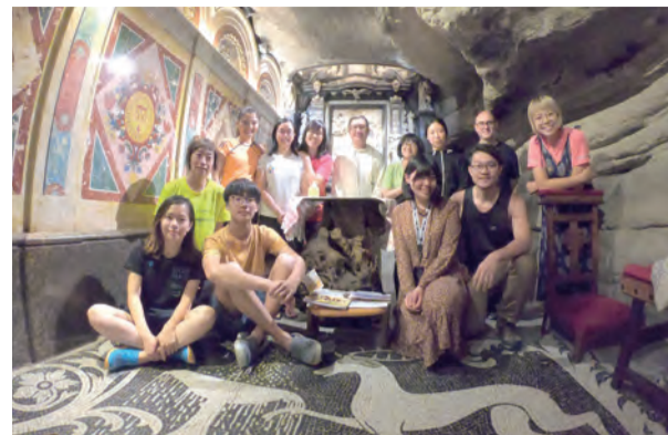
▲在聖依納爵過去寫下他靈修經驗的洞穴裡祈禱及彌撒